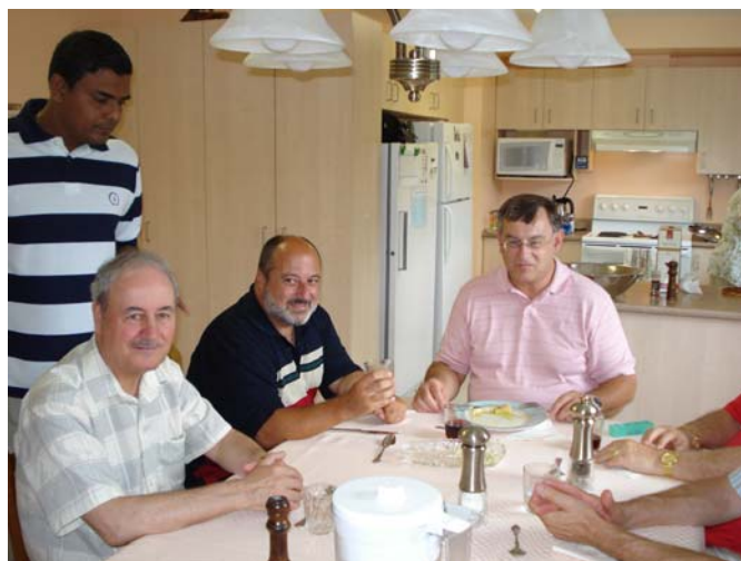
À la maison centrale à Trois-Rivières en juillet 2009