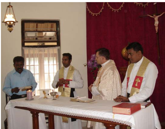
Voyage au Sri Lanka, en février 2009

Il m'a fait plaisir d'être au service de l'Institut à titre de directeur général. Ce fut pour moi une expérience de foi et d'approfondissement de la spiritualité des 5-5-5. Merci de m'avoir fait confiance et de m'avoir soutenu par votre amitié et votre prière. L'histoire d'amour commencée en 1978 lors de mes premiers contacts avec l'Institut se poursuit maintenant d'une manière différente.